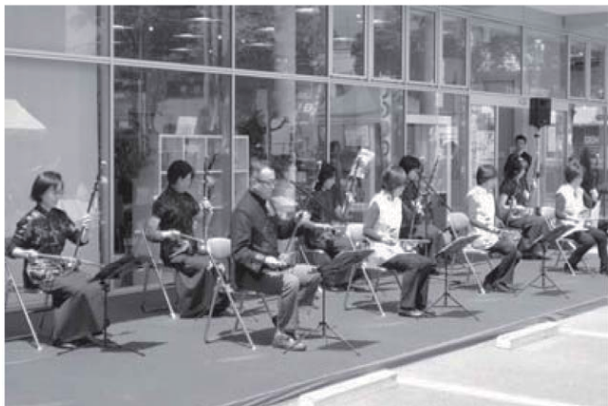
同じく二胡教室の皆さん、たった2本の弦から こんなに豊かな音が出るんですね