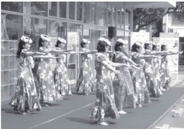
「くらしときめきアガミー」 フラダンス教室の皆さん 笑顔が素敵です