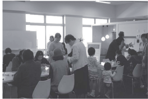
ハンドメイド教室も大人気でした (クリアート・苔玉・パッチワーク・クラフトバンドで工作作り)