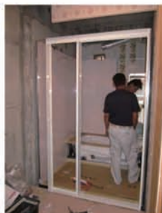
③土間コンが乾いたらシステムバスを組立します