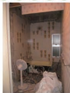
①浴室と脱衣室の間仕切り壁を解体します