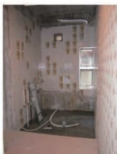
②床に土間コンをうちます