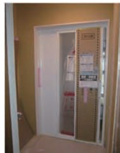
④脱衣室の間仕切壁を復旧します