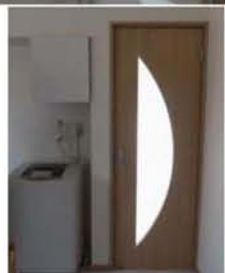
扉も取替し洗濯機上に収納を取付。

DK キッチンを明るい窓際へ位置を変更しました。もとのキッチンスペースには収納と脱衣室にあった洗濯機を移動。脱衣室には洗面化粧台が置けるようになりました。土壁だった壁もクロス貼に変更し白を基調にした明るいDKに変身しました。